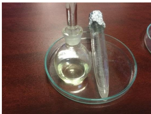
Figura 3. De izquierda a derecha se observa el aceite y polihidroxialcanoatos (PHA's) recuperados del medio de cultivo de Scenedesmus acuminatus , después de 24 días de incubación.