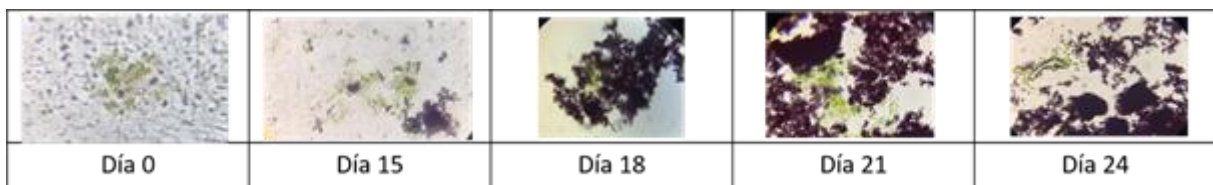
Figura 2. Producción de biopolímeros extracelulares por Scenedesmus acuminatus en 24 días de cultivo.

La síntesis de ácidos grasos y su exportación al medio de cultivo incrementó a partir de los 15 días de incubación; no se determinaron ácidos grasos en el cultivo celular, únicamente se recuperaron del medio de cultivo con la finalidad de emplear el cultivo celular en futuros estudios, en sistemas abiertos que permita reutilizar el cultivo. Ver figura 2.