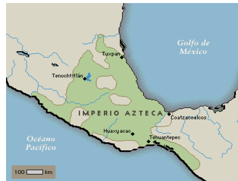
Figura 4. Territorios de los Aztecas.

Según Cervera (2008,) los Aztecas se establecieron en el valle de México ( figura 4 ), después de emigrar del lugar mítico llamado Aztlán. Según la narrativa azteca, esta era una isla o región situada al norte de lo que ahora es México, y desde allí emprendieron un largo viaje que los llevó al valle de México, donde finalmente fundaron la ciudad de Tenochtitlan en el año 1325.