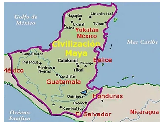
Figura 3. Territorios de los Mayas.

En su apogeo y consolidación, los antiguos Mayas prosperaron como una civilización altamente avanzada en la región de Mesoamérica. Se distinguieron por su impactante arquitectura, su sofisticado sistema de escritura, la precisión de su calendario y sus técnicas agrícolas innovadoras. Entre estas últimas, se destacan métodos como la rotación de cultivos en milpas, la construcción de terrazas agrícolas, la implementación de sistemas de riego y la domesticación de plantas como el maíz. Estas prácticas les permitieron mantener una población numerosa y erigir ciudades y centros ceremoniales de gran magnificencia (Wiesner, 2020; Pano, 2021).