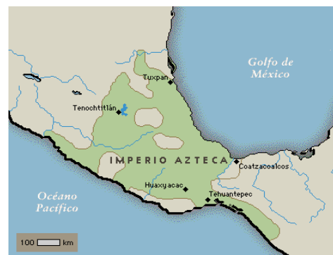
Figura 4. Territorios de los Aztecas.

Según Cervera (2008,) los Aztecas se establecieron en el valle de México (figura 4), después de emigrar del lugar mítico llamado Aztlán. Según la narrativa azteca, esta era una isla o región situada al norte de lo que ahora es México, y desde allí emprendieron un largo viaje que los llevó al valle de México, donde finalmente fundaron la ciudad de Tenochtitlan en el año 1325.