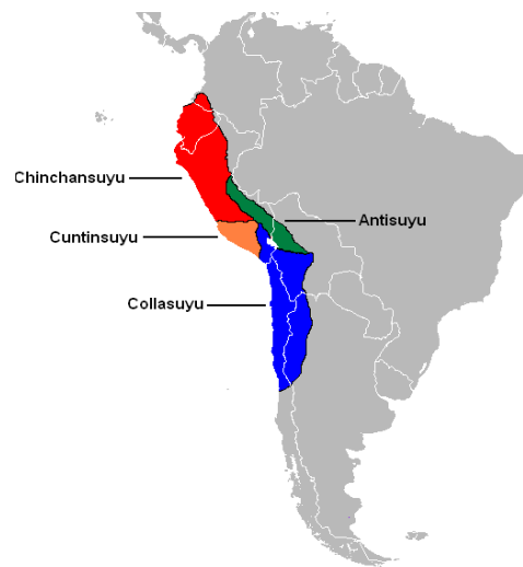
Figura 2. Territorios de los Incas.

Dicha aparición se ubica con la victoria de las etnias del Cuzco, del sur del actual Perú, cuyo líder fue Pachacútec, frente a la confederación de estados Chancas. Con Pachacútec, inicia su expansión el Imperio Incaico, que continuó con su hermano Cápac Yupanqui, luego con el décimo Inca Túpac Yupanqui y finalmente por el undécimo Inca Huayna Cápac, quien consolidó los territorios. La civilización Inca alcanzó la mayor expansión de su cultura, tecnología y ciencia, desarrollando no solo sus propios conocimientos, sino también los de la región andina y asimilando los de otros territorios que conquistaron (Betánzos, 2022). Este imperio abarcó cuatro territorios que denominaban Chinchasuyo, Cuntisuyo, Antisuyo y Collasuyo según se muestra en la figura 2 , con una parte importante de los actuales territorios de Perú, Ecuador y Bolivia; el sur de Colombia; el noroeste de Argentina; y el norte y centro de Chile (Cely, 2019).