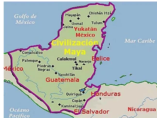
Figura 3. Territorios de los Mayas.

Los Aztecas son una de las culturas más poderosas en el territorio que correspondía a Mesoamérica. Tenían una gran estructura social y su economía estaba basada en diferentes actividades, desde el comercio y la agricultura hasta la elaboración de artesanías y a la conquista de nuevos territorios (Castillo, 2020).