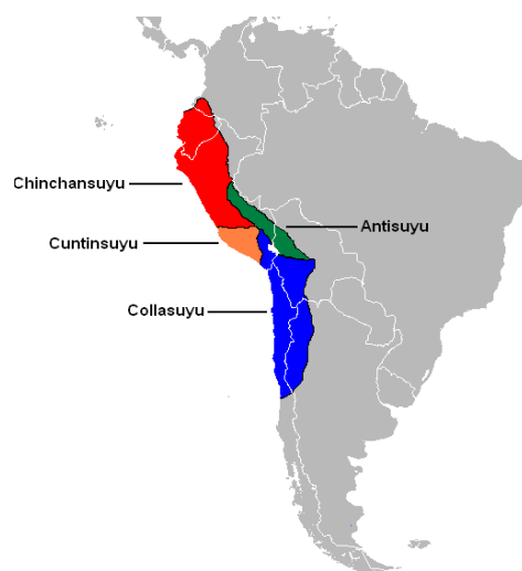
Figura 2. Territorios de los Incas.

Dicha aparición se ubica con la victoria de las etnias del Cuzco, del sur del actual Perú, cuyo líder fue Pachacútec, frente a la confederación de estados Chancas. Con Pachacútec, inicia su expansión el Imperio Incaico, que continuó con su hermano Cápac Yupanqui, luego con el décimo Inca Túpac Yupanqui y finalmente por el undécimo Inca Huayna Cápac, quien consolidó los territorios. La civilización Inca alcanzó la mayor expansión de su cultura, tecnología y ciencia, desarrollando no solo sus propios conocimientos, sino también los de la región andina y asimilando los de otros territorios que conquistaron (Betánzos, 2022). Este imperio abarcó cuatro territorios que denominaban Chinchasuyu, Cuntisuyo, Antisuyo y Collasuyo según se muestra en la figura 2, con una parte importante de los actuales territorios de Perú, Ecuador y Bolivia; el sur de Colombia; el noroeste de Argentina; y el norte y centro de Chile (Cely, 2019).